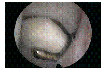
O.C.D. fragment in sprongewricht

Informatie folder voor eigenaren van paarden met Osteochondrosis Dissecans (OCD).